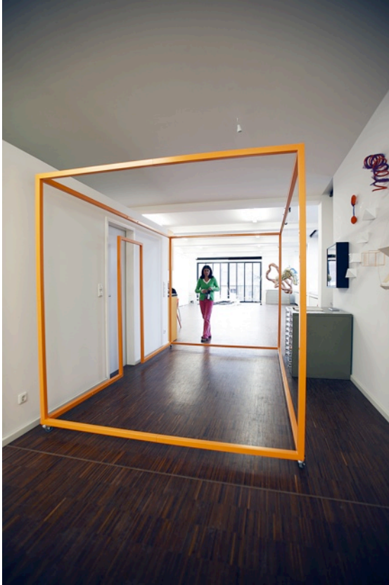
'Mobiler Raum', 2011