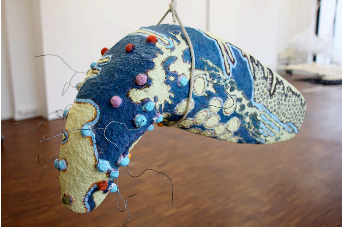
'Ohne Titel', 2011