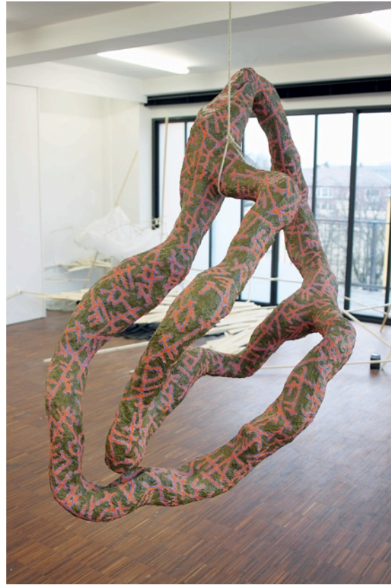
'Ohne Titel', 2011