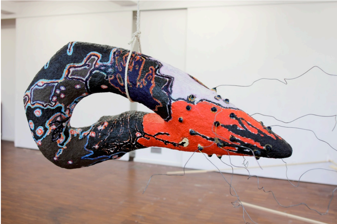
Ohne Titel', 2011