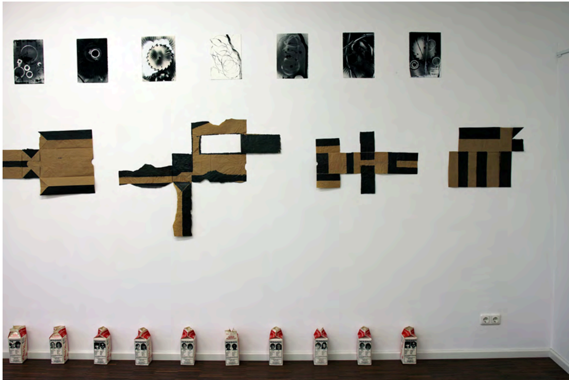
'DUMB0', 1995 - 'Brooklyn Brown Bags', 1986-90 - 'Milk for the Missing', 1986-88