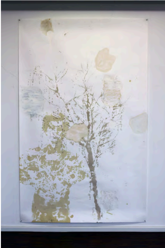
'Der Baum', 2006