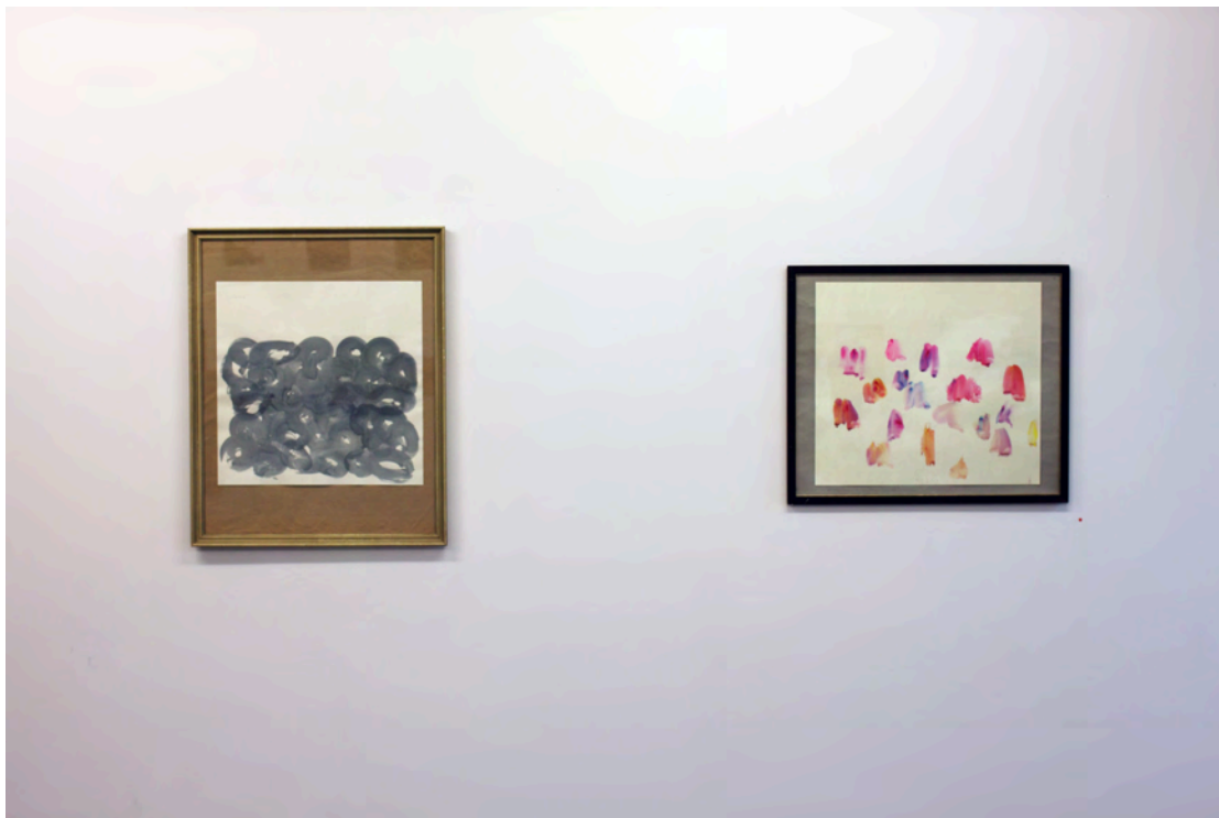
'1to6', 2010 - 'Ohne Titel', 2010