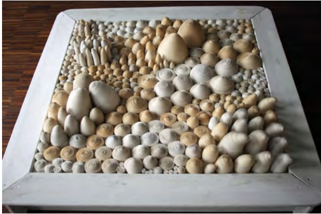
'Gerollert I', 2006