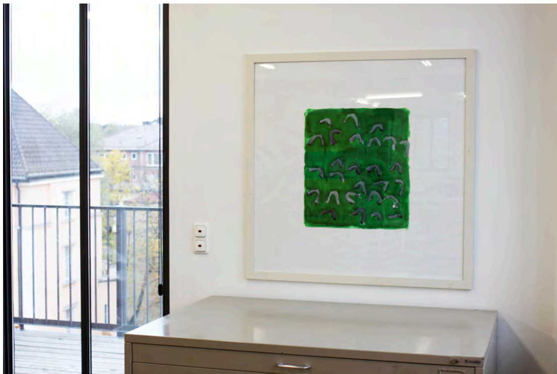
'Dynamo' , 2010