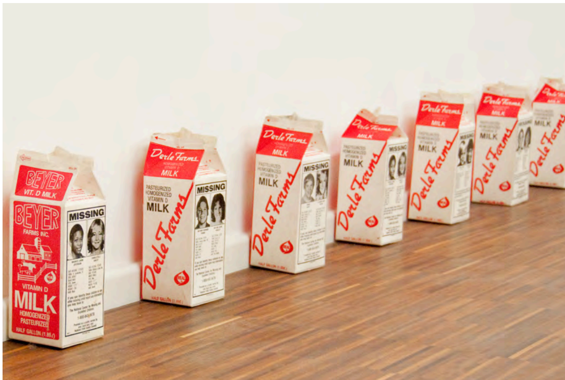
'Milk for the Missing', 1986-88