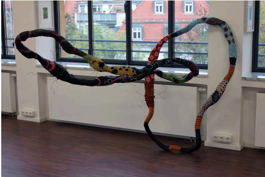
'Ohne Titel', 2010