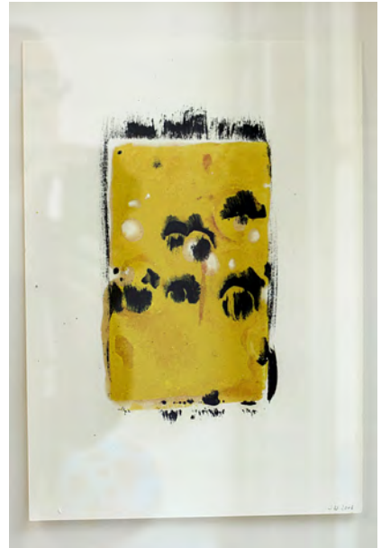
'Alles Käse', 2006