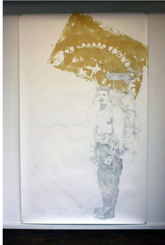
'Die Reise', 2006